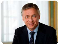
Patrick Dewael, Burgemeester Gaststad Tongeren

“De combinatie Tongeren en koers is een lange tijd weggeweest. Na een schitterende heropstart, 3 jaar geleden, zijn wij dan ook bijzonder trots dat we alvast tot en met 2018 als gaststad mogen fungeren tijdens dit fantastische event.”