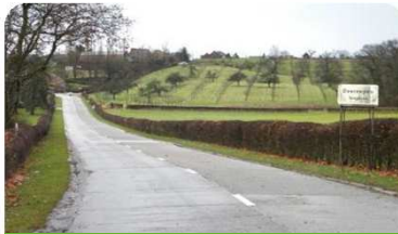
KOLMONTBERG - Overrepen