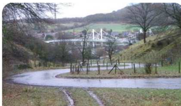
SLINGERBERG - Kanne