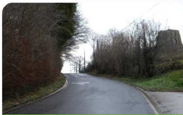
GLINBERG - Vliermaal